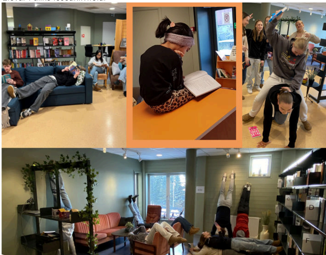
Elevar i ulike leseaktivitetar

Leseopplevinga blir felles når eleven formidlar henne. Dei kan formidle munnleg, skriftleg eller via visuelle og auditive medium. Skulen og biblioteket kan dele og skape rammer for dei ferdige formidlingsprodukta. For å støtte opp om eleven sin autonomi og oppleving av lyst, må elevane få oppleve at delinga er noko dei sjølve har kontroll over og lyst til å gjere, og ikkje som ein test.