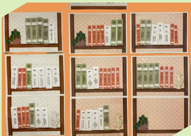
Døme på lesebarometer

Gjer litt ekstra ut av slutten på veka, til dømes ved å bruke Lesebarometeret vårt. Dette synleggjer kor mykje elevane faktisk har fått lese. Les meir om lesebarometeret vårt i aktivitetsheftet.